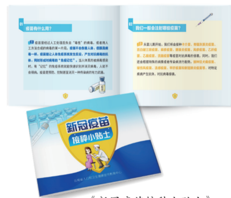
《新冠病毒接种小贴士》口袋书

“新冠疫苗我接种了”主题 logo，用于全省各地疫苗接种推广使用。所有健康科普资料电子版均已上传到“云南健康教育资料库”中，可以为全省各州市、县区卫生机构在开展健康科普提供支持。