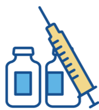
云南省人口和健康宣传教育中心

妊娠期和哺乳期的妇女不宜接种新冠病毒疫苗，对于新冠病毒感染风险比较高的哺乳期女性，如果不能避免感染的风险，建议按要求接种。对于有备孕计划的女性，不必仅因接种新冠病毒疫苗而推迟怀孕计划。在接种后如果发现怀孕，不建议采取终止妊娠等医学措施，但要做好孕期随访和定期检查。